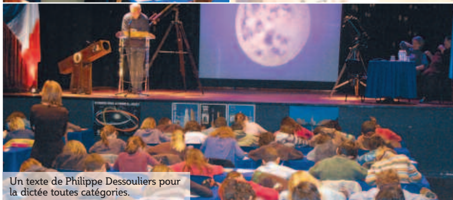
Un texte de Philippe Dessouliers pour la dictée toutes catégories.