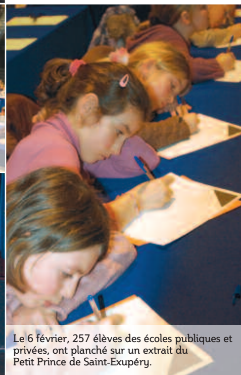
Le 6 février, 257 élèves des écoles publiques et privées, ont planché sur un extrait du Petit Prince de Saint-Exupéry.