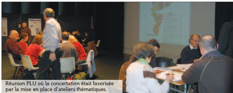
Réunion PLU où la concertation était favorisée par la mise en place d'ateliers thématiques.

La première réunion publique clôturant la phase de diagnostic réalisée par le bureau Espace-Ville s'est tenue fin janvier, à trois